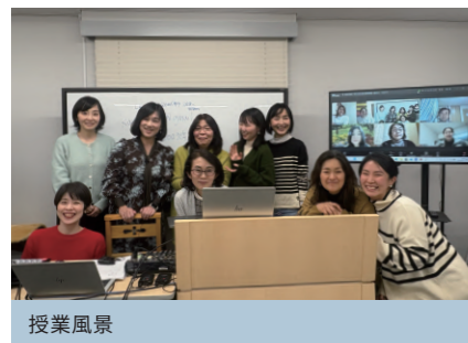
図書ラウンジでの交わり

2025年度は聖書科正科に1名、教会音楽科に5名が入学し、各学期に多数の聴講生を迎えて学びがもたれました。月1回あるいは学期に1回は対面授業を行うクラスも増え、授業後には図書ラウンジで食事をしながら神学談義を楽しむ光景がみられました。学院生同士も共に学ぶ仲間としての交わりが深まり、仲良くなってきた印象です。