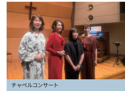
チャペルコンサート

特に、2025年度以降開講のボイストレーニングの教師と受講生による独唱・コーラス、聖歌隊クラスのJ.ラター作品による独唱・合唱賛美が、新しい風を吹き込んでくれたと感じております。